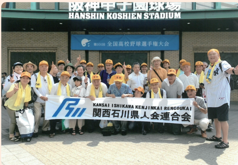
8月22日(木) 決勝戦前 対履正社高校